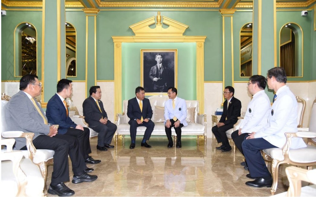
ภาพข่าวประชาสัมพันธ์เพิ่มเติม